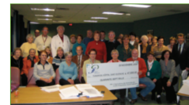
La Fondation tient à souligner le support constant de ses bénévoles !

L'Association des bénévoles s'est engagée à contribuer pour un montant de 40 000 $ annuellement au cours de la campagne majeure de financement qui se poursuit jusqu'en 2009.