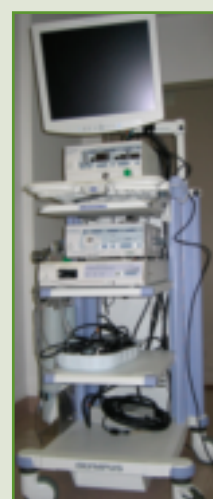
Appareil de laparoscopie, un équipement à la fine pointe de la technologie au coût de 225 000 $.

Pourquoi faire une chirurgie ouverte (avec une grande cicatrice) quand on peut ne faire que de petits trous ? La laparoscopie ressemble à l'endoscopie, mais en salle de chirurgie. C'est une technique qui permet de voir à l'intérieur du corps pendant la chirurgie. Le chirurgien insère des trocarts (tubes) par exemple dans l'abdomen, dont l'un comporte une caméra miniature. Il guide sa chirurgie à l'aide d'un écran sur lequel il visualise les organes qu'il opère via les trocarts. Pour le patient, la différence est majeure : beaucoup moins de douleur et de saignement, parce la « coupure » est bien moins profonde et longue. Il peut demeurer moins longtemps à l'hôpital, son rétablissement est beaucoup plus rapide et il peut donc réintégrer ses activités normales en moins de temps.